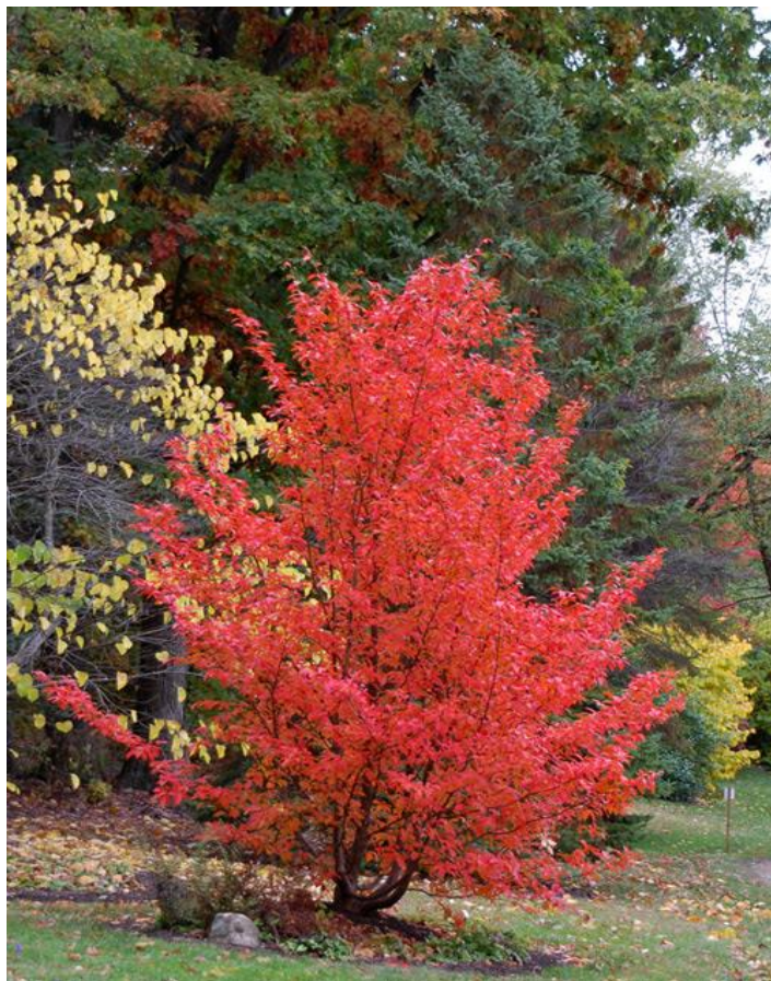
Stewartia iklædt efterårets smukke løv.

For er stammen og grenenes diameter større end 5-7 cm, får de et glat nærmest muskuløst udseende med et mat mønster i grå, orange, brune og grønne farver. Derfor er ældre træer og buske med mange stammer meget populære og eftertragtede. Stewartia pseudocamellia er et træ eller en busk, man kan have glæde af hele året, og derfor bør det plantes et sted, hvor det ofte ses.